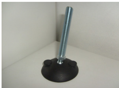
HASTE EM FERRO ZINCADO