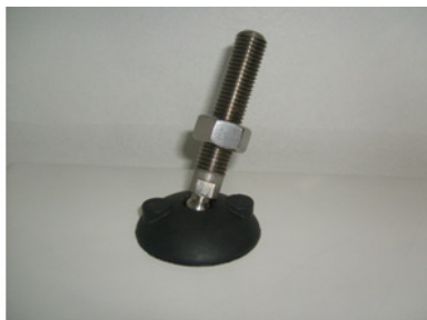
HASTE EM AÇO-INOX-304